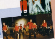
Danse sportive Danse Hip Hop