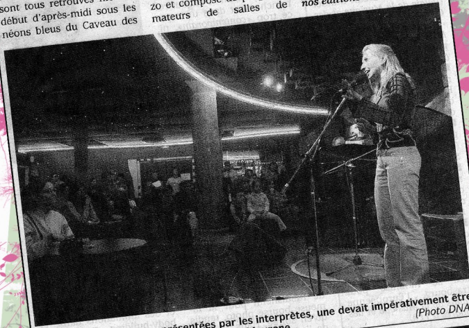
Parmi les deux chansons présentées par les interprètes, une devait impérativement être tirée du répertoire d'Alain Souchon ou de Maurane.

★ Tous les résultats du concours paraîtront dans nos éditions de mardi.